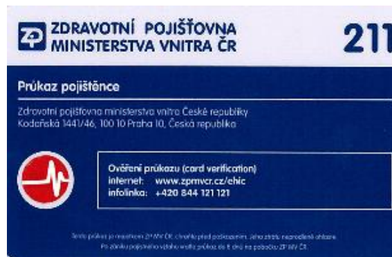
Karta života pojištěnce ZP MV ČR