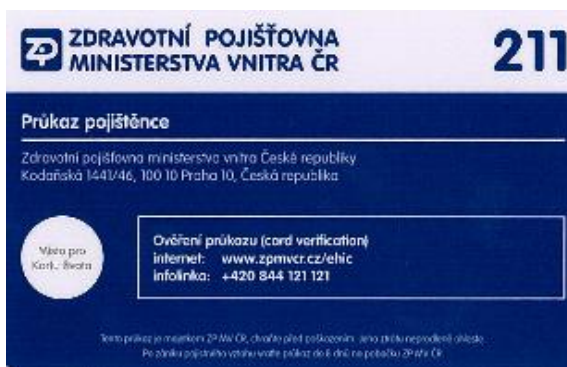
Průkaz pojištěnce ZP MV ČR